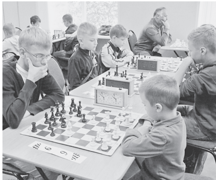
В шахматном клубе начался новый учебный сезон