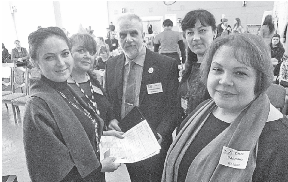
Педагоги 8-й школы — в центре событий