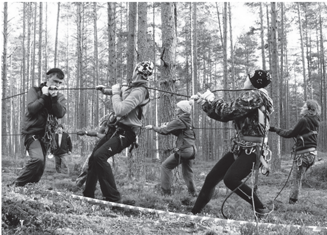
Переправа на тросах